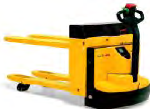
R 366 de la CNAM TS