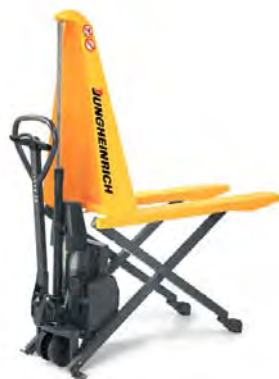
R 367 de la CNAM TS