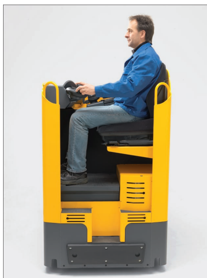
Position assise confortable avec un vaste espace disponible pour les jambes