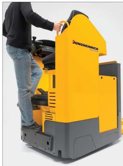
Meilleure sécurité d'accès grâce à un marchepied surbaissé et une poignée largement dimensionnée