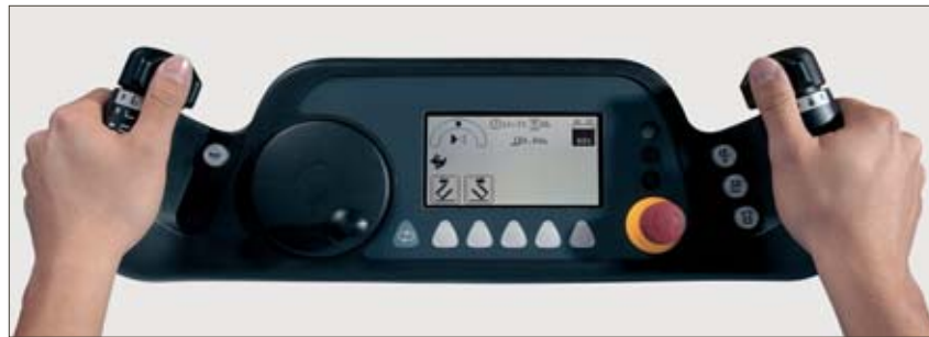
Pupitre de commande