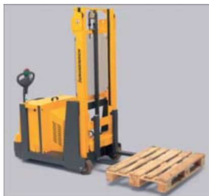
Prise transversale de palettes sans problème