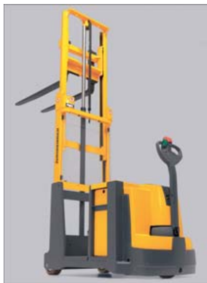
Bonne visibilité à travers le mât