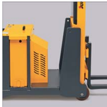
Extraction latérale de la batterie (option) et bloc hydraulique situé à l'avant