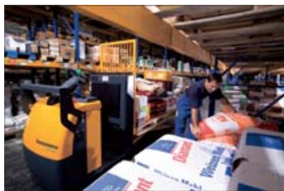
Confort de la conduite et rapidité de la préparation de commandes