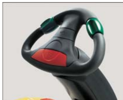
JetPilot – une exclusivité Jungheinrich