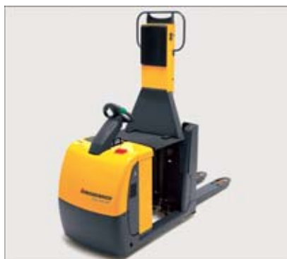
Préparation de commandes jusqu'au deuxième niveau avec plate-forme élevable