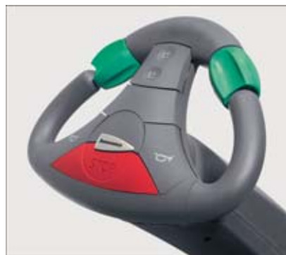
JetPilot – exclusivité Jungheinrich