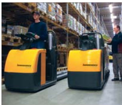
Confort de la conduite et rapidité de la préparation de commandes