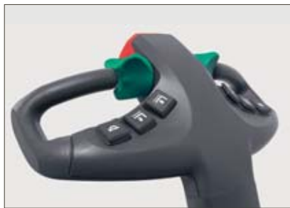
Tête de timon multifonctions

Le variateur électronique de translation Jungheinrich « SpeedControl » assure le confort et la sécurité de la translation et offre des possibilités d'adaptation à chaque cas d'utilisation : ■ Maintien de la vitesse de translation présélectionnée dans toutes les situations, en montée comme en descente.