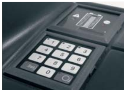
Jungheinrich CanCode et CanDis (options)