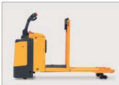
Garde au sol excellente grâce à la levée de la batterie et de la plateforme