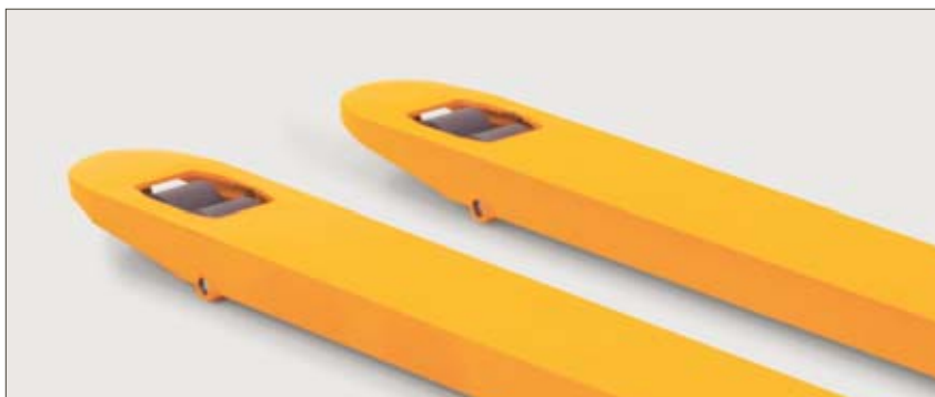
Robustesse des fourches

Un angle de braquage de 105° dans chaque direction offre une maniabilité maximale aussi bien en allées étroites que dans les camions.